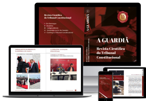
[e-book para leitura]

E-book da Revista Científica “A GUARDIÃ” disponibilizada no Site do Tribunal Constitucional.